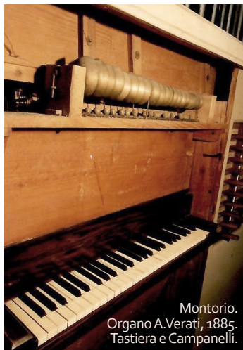
Montorio. Organo A. Verati, 1885. Tastiera e Campanelli.